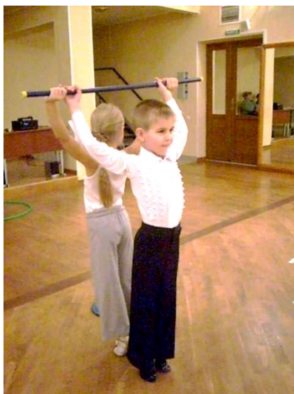
Рис. 1. Выполнение задания «Кто выше» с гимнастической палкой.

Упражнение выполняется в парах, используя гимнастическую палку (Рис. 1).