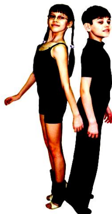
Рис. 2. Выполнение задания «Кто выше»

Методическое указание: упражнение выполняется с гимнастической палкой для взаимного тактильного контроля, после усвоения – без палки у зеркала, используя зрительный контроль (Рис. 2).