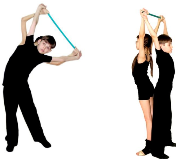
Рис. 4. Выполнение задания «Наклоны»

Упражнение выполняется с гимнастической палкой, в парах (Рис. 4).