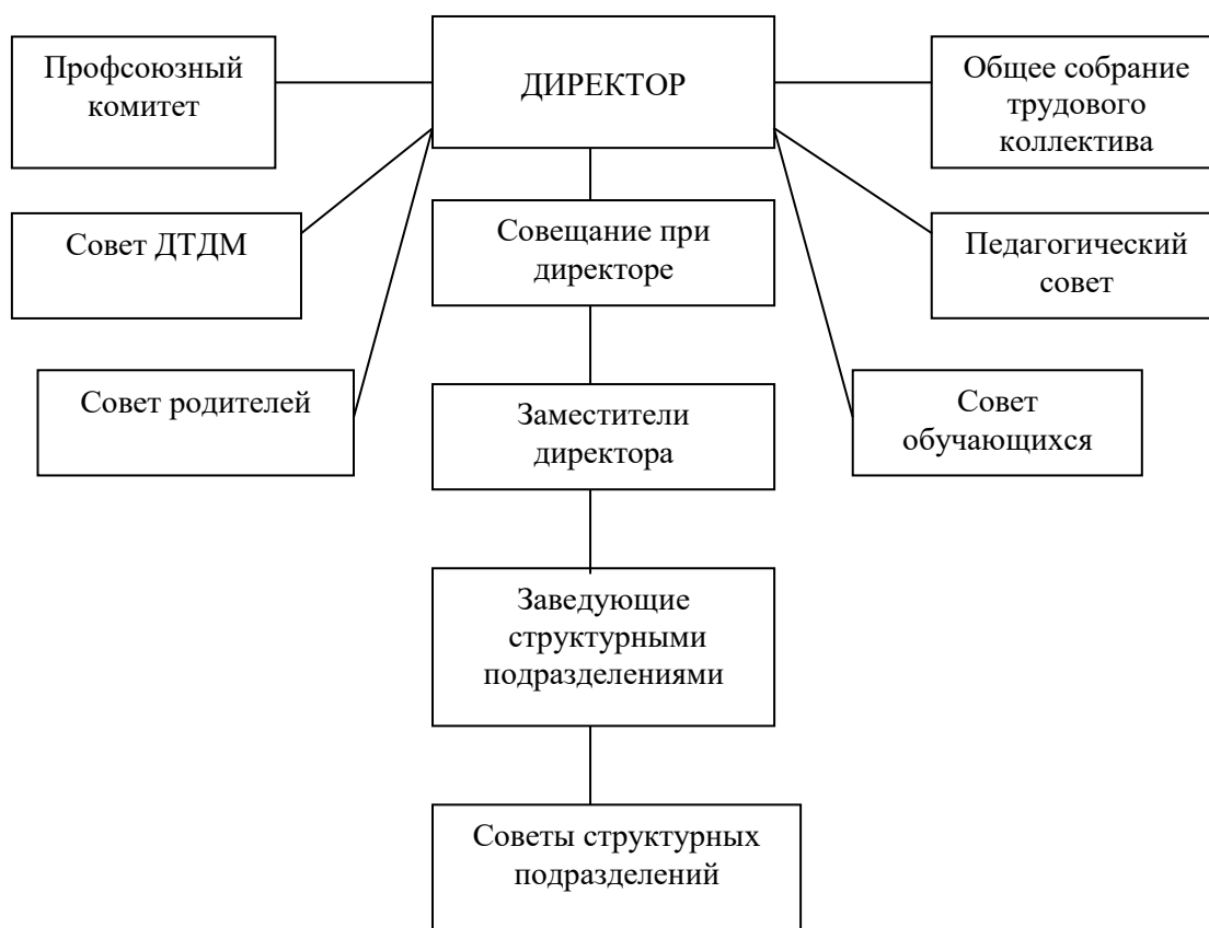
Структура управления, организация деятельности

Управление образовательным процессом во Дворце творчества реализуется через следующую структуру.