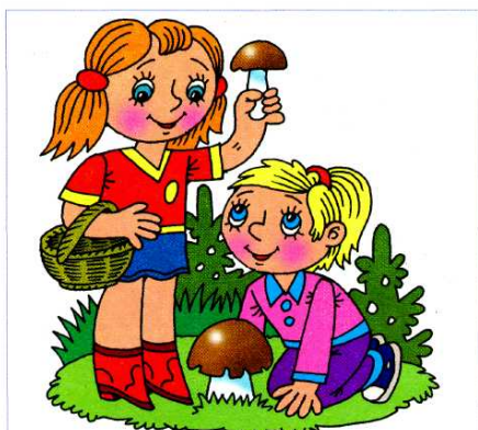
Девочки собирают грибы.

Прочитайте предложение, состоящее из 4 слов, из двух слов, из одного слова.